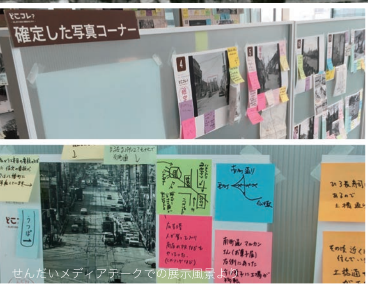
せんだいメディアテークでの展示風景

この写真は、いつ、どこから、どの方角を撮ったものだろう? 写っているのは何だろう? 思い出される当時のオモイデは?